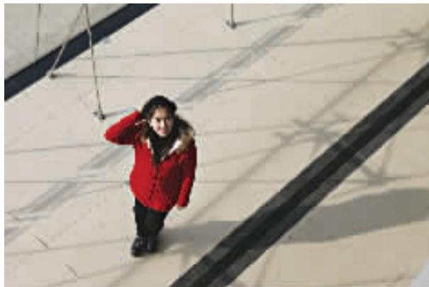
“青女郎”进东华大学活动