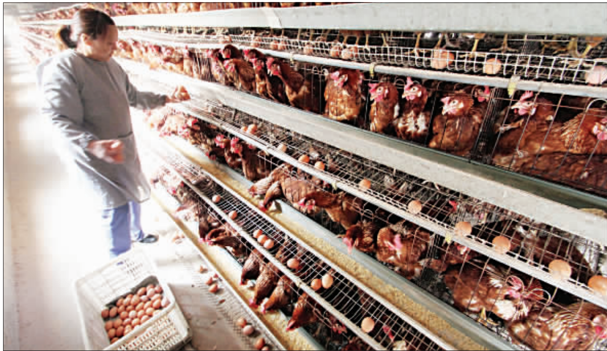
食品安全不容忽视。