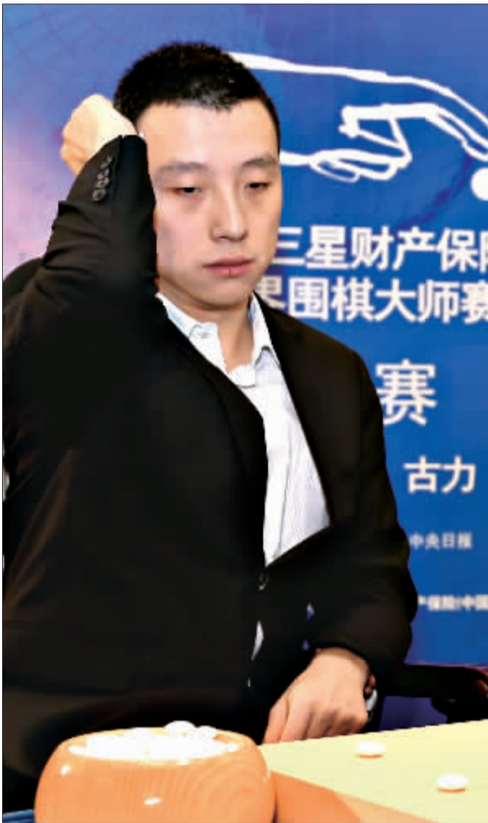
虽然遗憾地输了三星杯,但古力对李世石依然大加赞赏。

当然,就本届三星杯来说,古力和李世石两人对彼此的战绩都是两胜两负一和(因为下出四劫循环无胜负时,古力赢了加赛),所以,世纪大战并没有因为最终谁夺冠,而显得稍微逊色。两人也都希望,世纪大战可以继续下去。“我希望能和李世石先生有100盘的对局!”古力发愿。