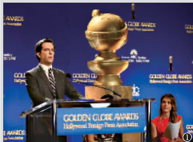
①艾德·赫姆斯昨日现场宣读金球奖提名。