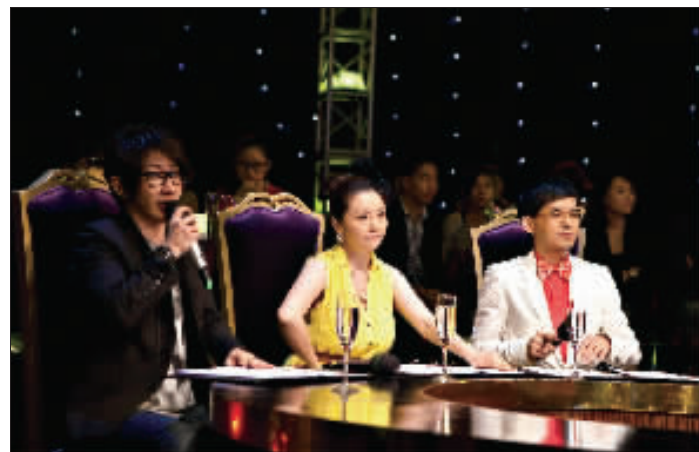
大型魔术真人秀《魔法偶像》渐入佳境。