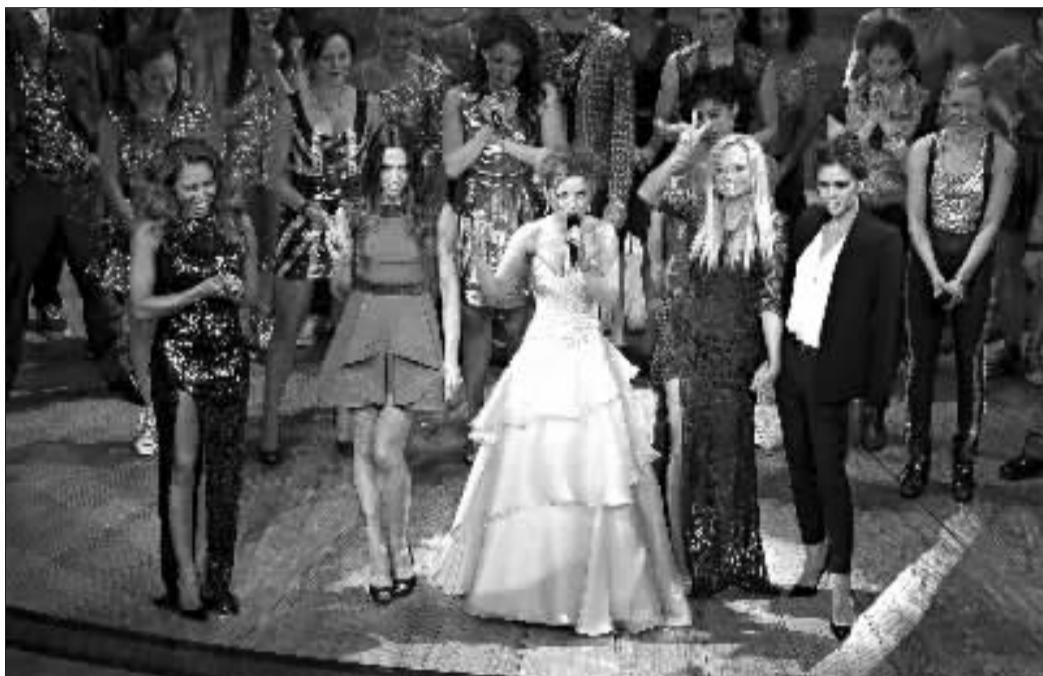
五位辣妹在《完美世界》首映式上同台谢幕。