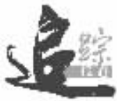
酒店标牌形似交通指示牌

其实,每日每夜,总有负相关职责的人员奔走在大街小巷,做着市民看得见或看不见的工作。每一块消失的违规标牌,都是各部门协调管理的结果。请珍惜,请配合,请守法,请自律,因为我我们都生在这座城,长在这座城,共同担负着建设、维护和谐市容的义务和职责。