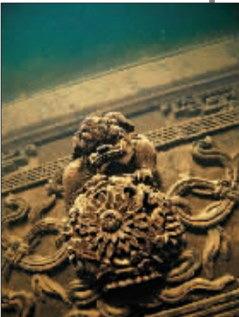
千岛湖水下古城保存完好。