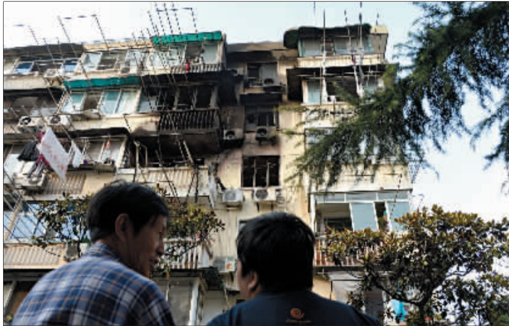
逸仙路1321弄120号4楼发生火灾，大火殃及到5楼的居民家中。