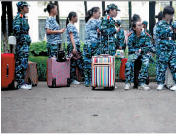
迷彩军训衣和多彩拉杆箱组成一幅有趣的画面。