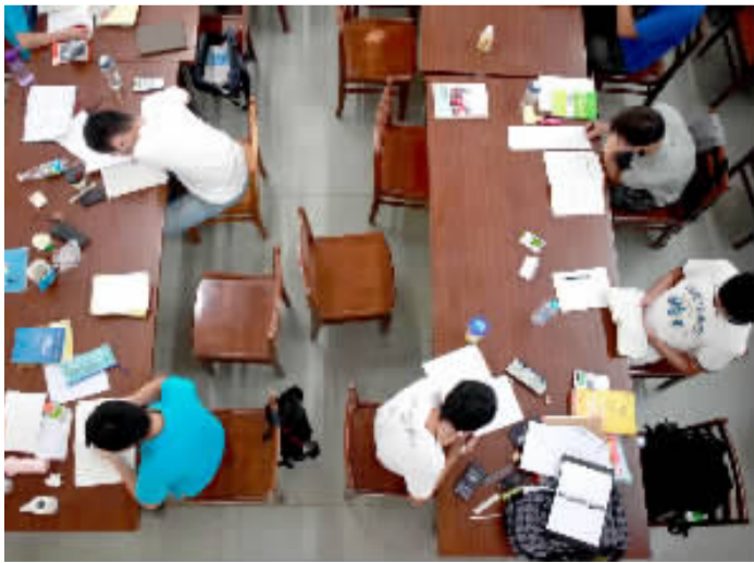
图书馆是个看书和思考的好地方。