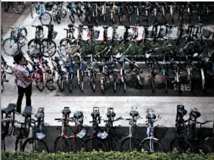
鳞次栉比排列着的自行车堪称大学校园一景。