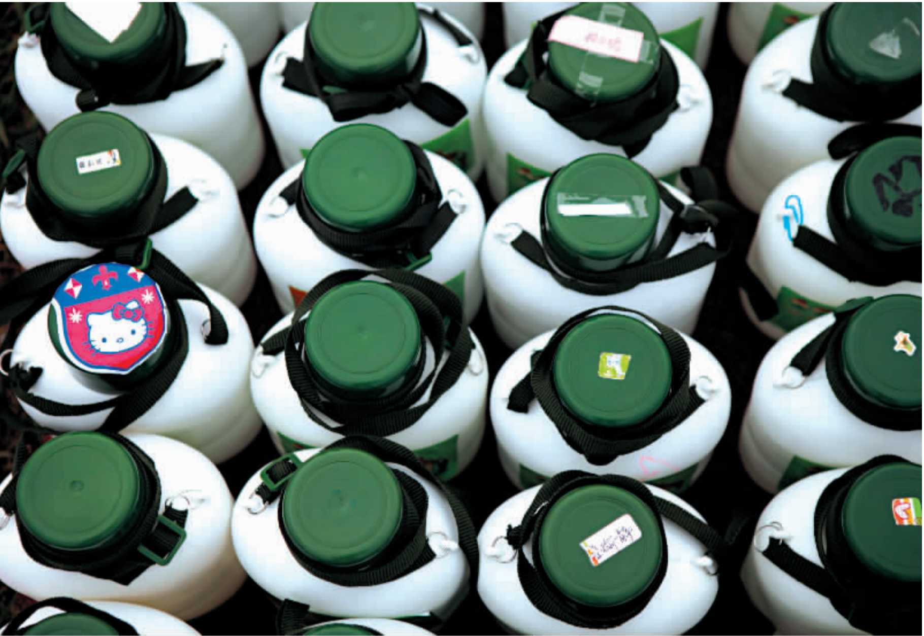
新生军训用的水壶整齐又不失个性。