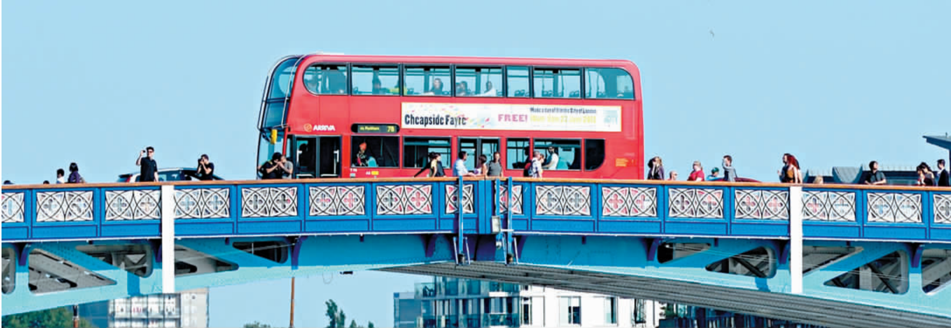
虽然巴士在整个奥运期间将正常运营,但背后却是政府付出的高昂代价。