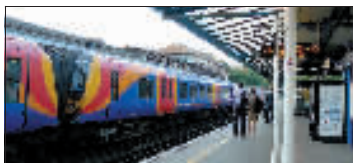
伦敦火车。

今年3月,西南铁路公司和员工达成协议,奥运期间工资提高4.75%,部分员工得到1000英镑的奥运奖金,另一部分得到850英镑。奥运在即,滑铁卢车站的员工有时要加班到凌晨2点,他们认为应该拿到更多奖金,于是提出在奥运会期间拒绝加班甚至罢工。