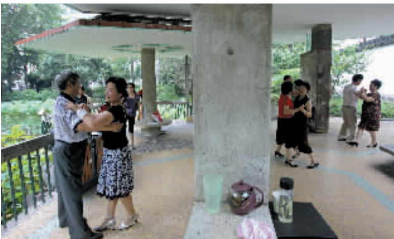
不少阿姨爷叔把跳舞的地点从舞厅转向公园。