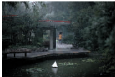
突然降临的大雨让公园里的游客措手不及。