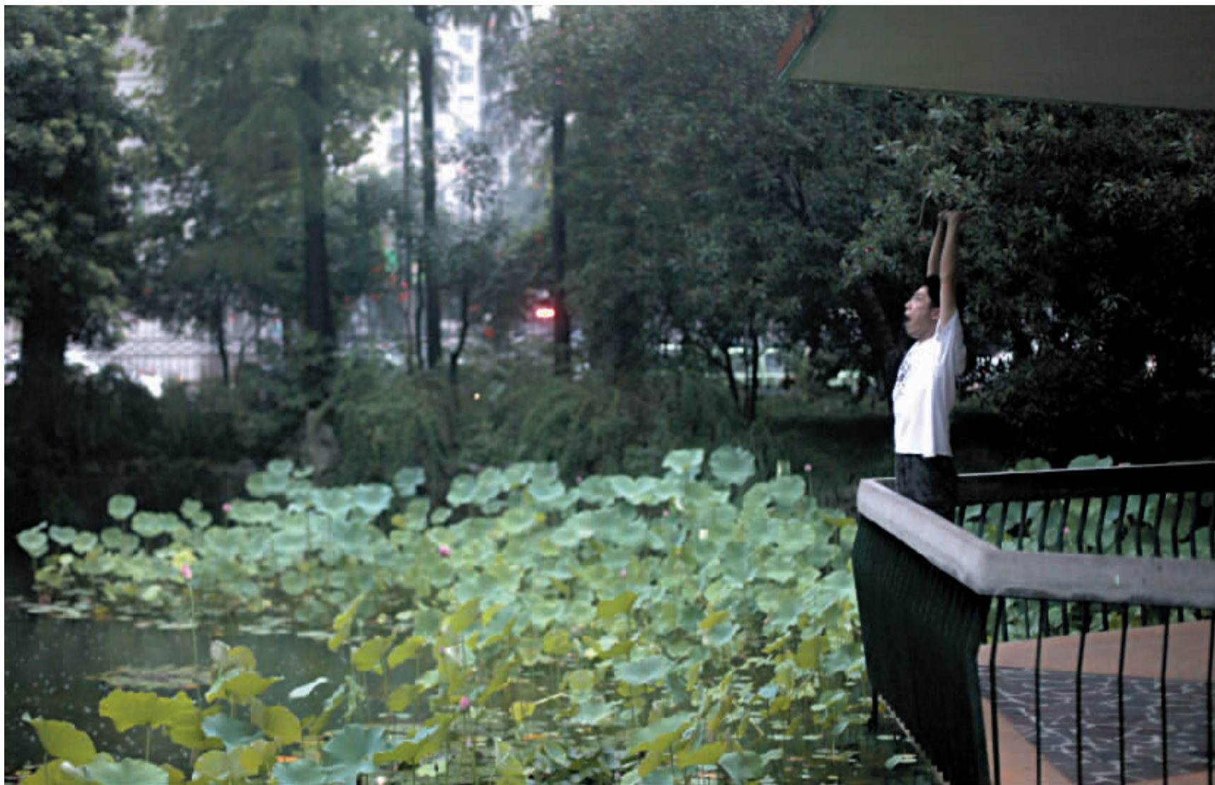
刚刚睡完午觉的年轻人对着荷花池伸了个懒腰。

小时候我家后面有一个不大的公园,里面没什么游乐设施,父母告诉我公园里有一个很伟大的人的墓,至于是谁干啥的他们也说不清,但那时那儿却是我的乐园,每次去骑个石马,爬个土坡,挖个蚯蚓捞个蝌蚪一天也就晃悠过去了,后来读了小学也就搬离了那儿,连最末次去那儿也已经相隔七八年了。