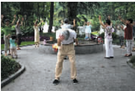
每天清晨,周边的老人来到公园锻炼身体。

小时候我家后面有一个不大的公园,里面没什么游乐设施,父母告诉我公园里有一个很伟大的人的墓,至于是谁干啥的他们也说不清,但那时那儿却是我的乐园,每次去骑个石马,爬个土坡,挖个蚯蚓捞个蝌蚪一天也就晃悠过去了,后来读了小学也就搬离了那儿,连最末次去那儿也已经相隔七八年了。