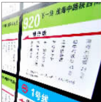
“线路”全由各色菜式构成。

到底菜单能不能做成“站牌”的形式？带着这个问题，记者采访了上海交通运输管理处的有关负