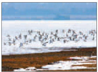
爱好者拍摄的候鸟。