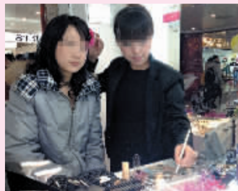
化妆师用自己的夹子帮顾客夹头发。

正值下午一点多钟,专柜只有一名工作人员,她不仅要忙于给记者化妆,还要不时地给前来选购化妆品的顾客介绍产品。因此,化妆总不能正常地进行下去,工作人员也无法好好帮顾客服务,由于实在忙不过来,工作人员在给记者画眉毛以及涂睫毛膏的时候,只是简单地两三笔就带过了,效果实在差强人意。