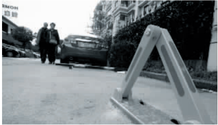
公共通道(左图深色区域)私装地锁引发邻里矛盾。